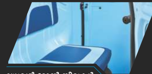
ഡ്യൂവൽ ടോൺ സീറ്റുകൾ